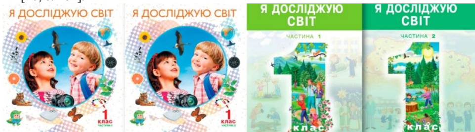
Рис. 4. Приклади ідентичного оформлення різних частин підручників

2. Дві частини підручника мають ідентичне оформлення. Якщо підручник випущено у двох частинах варто виконувати кожну частину в єдиному стилі, але з різними зображувальними чи декоративними елементами. Порівняймо оформлення обкладинок на рис. 4. У прикладі справа перша і друга частини підручників об'єднані спільною композицією, проте мають різну кольорову гаму та різні зображення, що сприяє успішному орієнтуванню учнів у навчальному матеріалі, мотивує переходити до наступної частини в процесі навчання[10, с. 161].