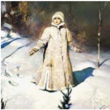
А. Васнецов. Снігуронька