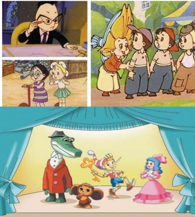
Рис. 1. Ілюстрації з підручника «Мистецтво»

чуємо) та брак розумного балансу між радянським спадком і сучасними анімаційними шедеврами, які дуже подобаються дітям, є значним недоліком цих підручників.