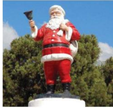
Дід Мороз (Туреччина)