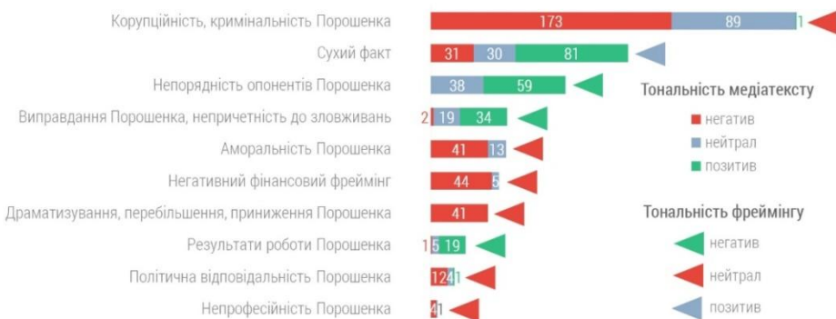
Рис. 3. Порівняння тональності повідомлень з тональністю їх фреймінгу. Кількість повідомлень.

Помітним є переважання негативної і позитивної тональностей над нейтральною, що надає більшості повідомлень заангажований характер. Навіть серед повідомлень з нульовим фреймінгом лише 30 зі 142 мали нейтральну тональність, що становить близько 21%.