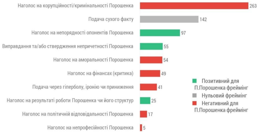
Рис. 1. Найпоширеніші типи фреймінгу в медіатекстах вибірки, кількість повідомлень.

Адміністрацією президента: зокрема наголос на непорядності і неавторитетності опонентів П.Порошенка. Ймовірно, АП навмисно обрала таку стратегію, вирішивши, що виправданям аудиторія довіряє менше, ніж контраатакам.